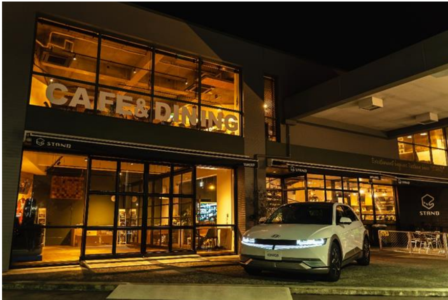
テスト 1 号店 / 東光グループ カフェ&ダイニング「STAND (スタンド)」

三菱商事エネルギー株式会社（東京都千代田区大手町、代表取締役：南浩一、以下 MCE）は、MCE と MCE の関連会社・株式会社カーフロンティアの有するガソリンスタンド（以下、SS）約 5,000 店のネットワークを活用した、電気自動車（以下 EV）車両の展示、試乗、EC 購入サポート、納車、洗車・コーティング、充電などのサービス提供の事業検証を開始いたします。