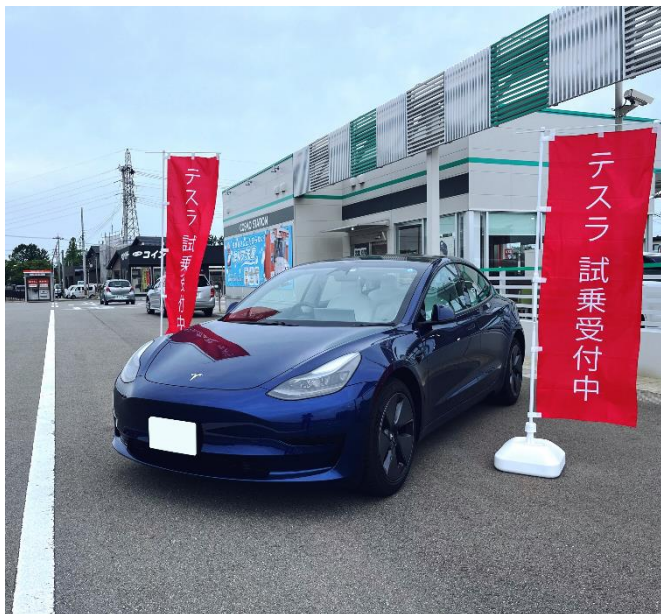
(株)金沢丸善 イータウン白山セルフ北安田 SS（石川県白山市）

当社は今年 2 月に、当社と当社の関連会社である株式会社カーフロンティアが有するガソリンスタンド（以下、SS）約 5,000 店のネットワークを活用した、EV モビリティサービス拠点の事業検証を開始しました。第 1 弾として熊本県にある SS 跡地を活用したカフェにおいて実施しましたが、今回、第 2 弾として SS における事業検証を行います。