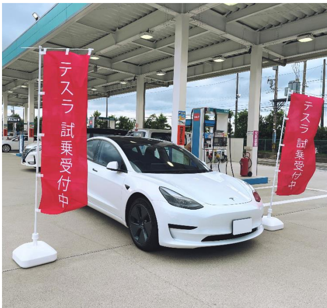
(株)ワンダフル工房 ワンダフルセルフ富山東 SS（富山県富山市）

試乗予約 https://timy.jp/8701/menu/ichioishi/select?middleCategoryId=83