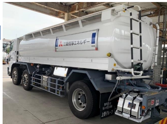
D-HAT1000 搭載トラック (トラック後方、下部に搭載)